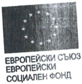
Схема за предоставяне на безвъзмездна помощ BG05M9OP001-2.004 „Услуги за ранно детско развитие“ Проект № BG05M9OP001-2.004-0042 „Комплекс за социално-здравни услуги за деца и семейства“