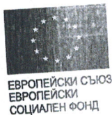
Схема за предоставяне на безвъзмездна помощ BG05M9OP001-2.004

„Услуги за ранно детско развитие“ Проект № BG05M9OP001-2.004-0042