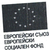
Схема за предоставяне на безвъзмездна помощ BG05M9OP001-2.004

„Услуги за ранно детско развитие“ Проект № BG05M9OP001-2.004-0042