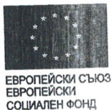
Схема за предоставяне на безвъзмездна помощ BG05M9OP001-2.004

„Услуги за ранно детско развитие“ Проект № BG05M9OP001-2.004-0042 „Комплекс за социално-здравни услуги за деца и семейства“